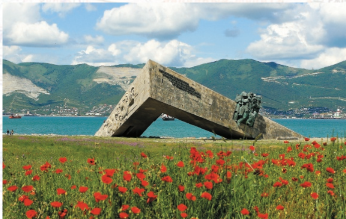
Ансамбль «Малая Земля» г. Новороссийск Автор мемориала – известный советский скульптор Владимир ЦИГАЛЬ

Из поколения в поколение будет передаваться великая летопись героических свершений нашего народа.