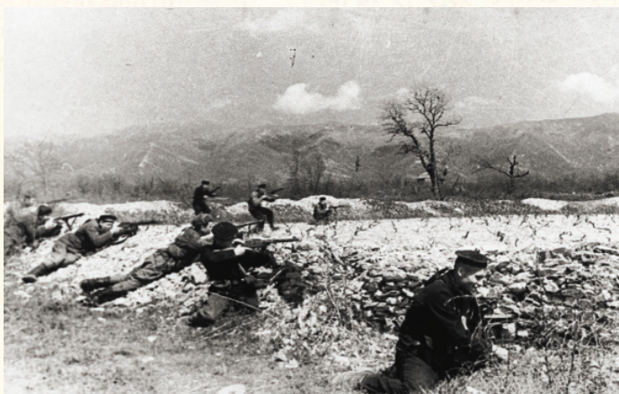
Бой на Малой Земле Автоматчики отряда Ц. Куникова ведут огонь по противнику. 10 апреля 1943 года