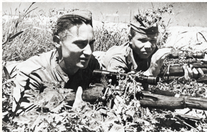
Бой на Малой Земле