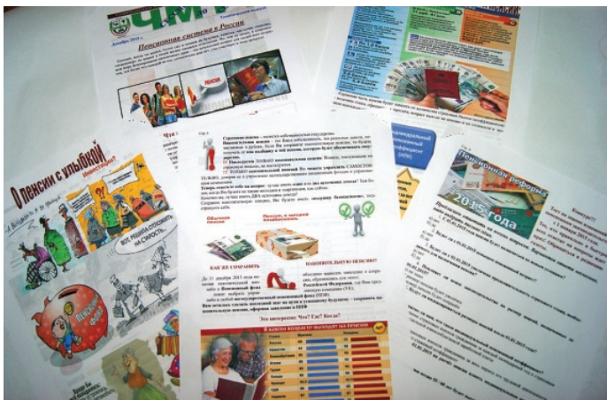
Первое место Редколлегия Чебоксарского механико-технологического техникума

В рамках программы повышения пенсионной грамотности молодежи Управлением ПФР совместно с Министерством образования и ЗАО «НПФ «Промгагрофонд» (г. Чебоксары) был организован городской конкурс информационных газет пенсионной тематики среди учащихся средних специальных учебных заведений.